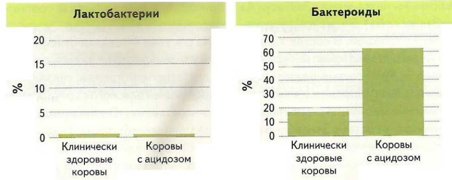
Рис. 3. Определение методом NGS-секвенирования уровня лактат-синтезирующих бактерий в рубце у клинически здоровых коров и при ацидозе (усредненные данные по 5 тысячам образцов)

На основании изучения более 5 тысяч образцов содержимого рубца с применением молекулярно-генетических методов (NGS-секвенирование) специалистами НПК «БИОТРОФ» доказано, что его перегрузка доступными формами энергии приводит к резкому повышению кислотоустойчивой популяции амилолитических бактериоидов. Их доля может достигать 90–95% в рубце у животных с ацидозом (рис. 3). Интересно, что, вопреки традиционным представлениям, на фоне данного заболевания среди группы лактат-синтезирующих бактерий микроорганизмы рода Lactobacillus не проявляют быстрые темпы роста.