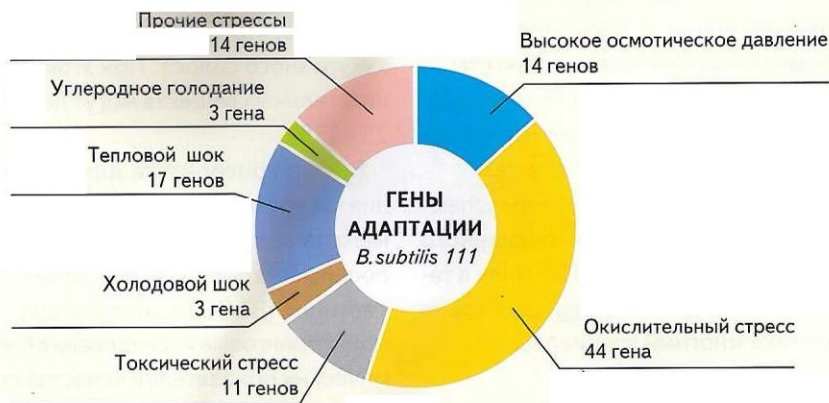
Рис. 1. Гены адаптации к стрессам у штамма бактерии Bacillus spp. в биопрепаратах Промилк и Биотроф-111

Компанией «БИОТРОФ» разработан высокоэффективный консервант Промилк (сухой аналог биопрепарата Биотроф-111), который представляет собой размноженную чистую и лиофильно высушенную культуру бактерий Bacillus spp. Последние, в отличие от лактобактерий, прекрасно переносят высушивание за счет способности